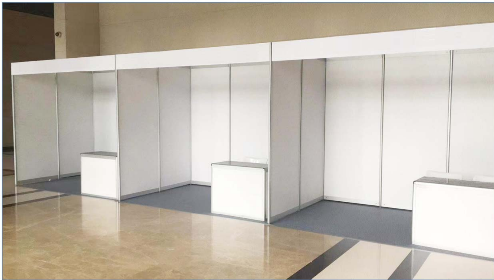
( 3×3m 标准展台 )