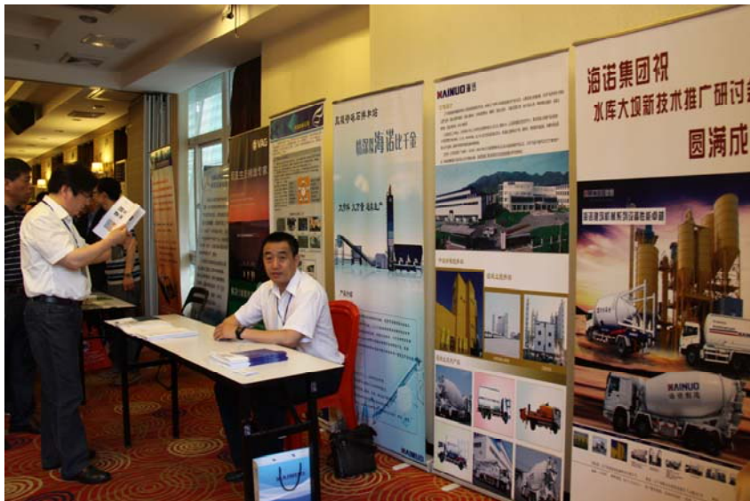
图 2 往届会议易拉宝宣传